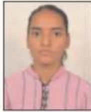
Palak (Chess) Inter University