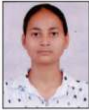
Nishu (Chess) Inter University