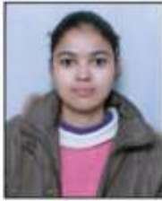
Shveta (Chess) Inter University