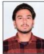
Sunil Kumar Laghu Film (IInd) Inter University Competition